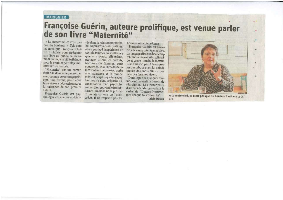
Le Dauphiné libéré du 26 janvier 2020