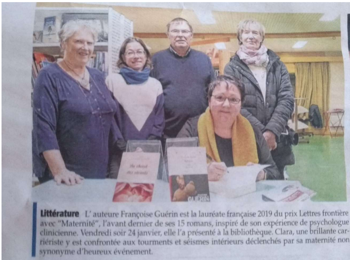
Le Messenger du 30 janvier 2020