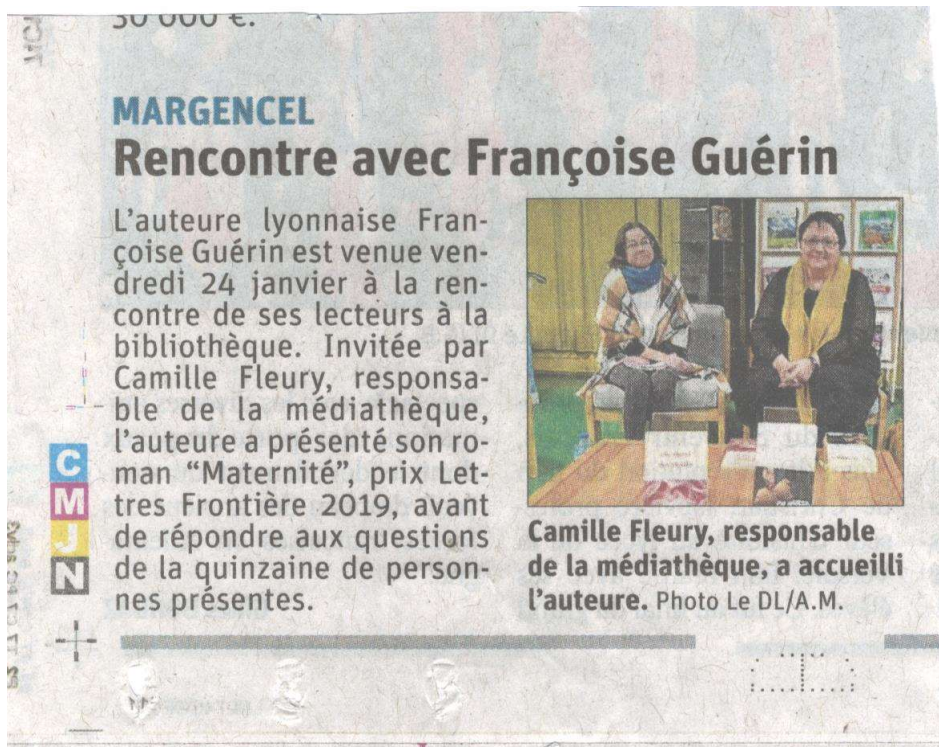
Le Dauphiné libéré du 25 janvier 2020