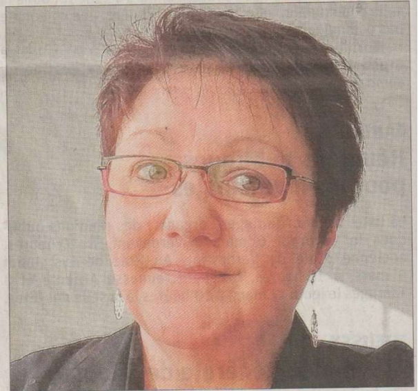
Avec "Maternité", Françoise Guérin met des mots sur ce que bien des femmes vivent...

Vendredi 6 mars à 19 h 30 à la bibliothèque municipale d'Arenthon. Entrée libre.